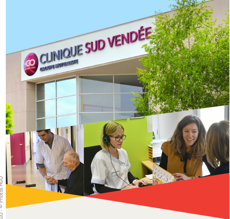
01/2018 - Service Communication HGO - © Photos HGO

HOSPI GRAND OUEST Groupe Mutualiste 29 Quai François Mitterrand 44273 Nantes Cedex 2